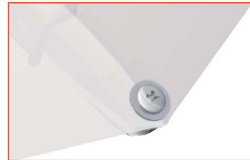
3a Variante Glatz mit Schraube und Unterlegscheibe