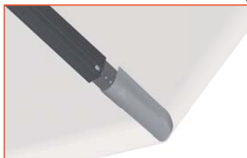
7a Variante Glatz