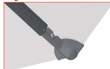
7b Variante QD