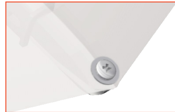
3a Variante Glatz mit Schraube und Unterlegscheibe