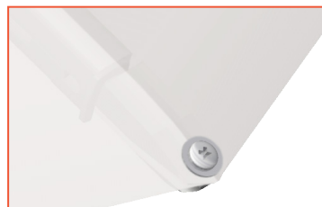
a Variante Glatz mit Schraube und Unterlegscheibe