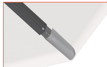
7a Variante Glatz